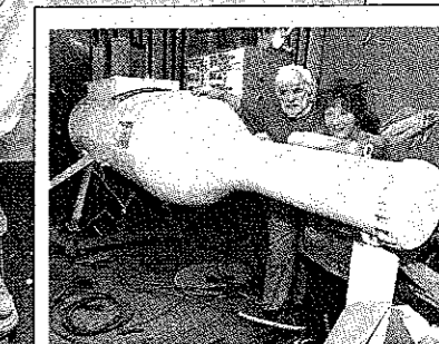
De maquette van een eerder ontwerp van de fles. Hoe het gevaarte er nu uitziet, blijft tot zaterdag geheim.